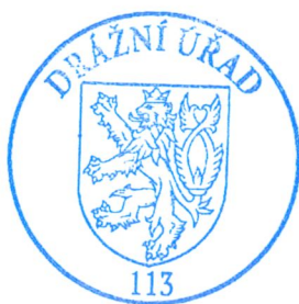
z p. Luděk Pettrich za ředitele územního odboru Praha

Proti tomuto rozhodnutí může účastník řízení podat odvolání, podle § 81 odst. 1 správního řádu ve lhůtě 15 dnů ode dne jeho oznámení, k Ministerstvu dopravy, podáním učiněným u Drážního úřadu, sekce infrastruktury - územní odbor Praha, Wilsonova 300/8, 12106 Praha 2. Odvolání jen proti odůvodnění rozhodnutí je podle § 82 odst. 1 správního řádu nepřípustné . Odvolání se podává s potřebným počtem vyhotovení tak, aby jeden stejnopis zůstal správnímu orgánu, a aby každý účastník dostal jeden stejnopis. Nepodá-li účastník potřebný počet stejnopisů, vyhotoví je Drážní úřad na náklady účastníka.